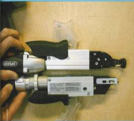
De Spero heeft bij het ontwerp van het voorzetstuk goed naar Bühnen gekeken.