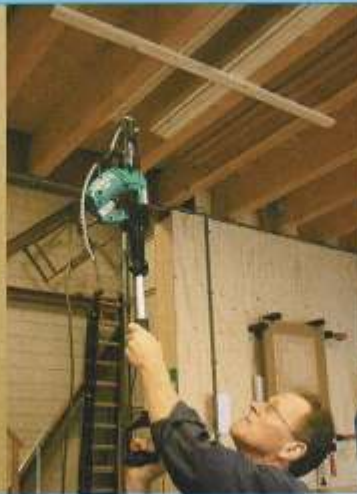
De Makita levert ook zeer goede prestaties met het verlengstuk.